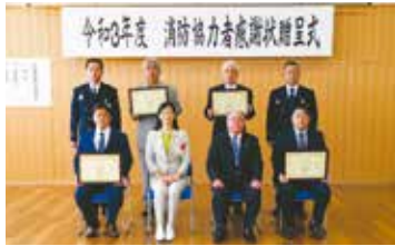
消防協力者感謝状贈呈式