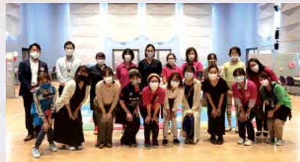
座間子育て応援プロジェクト! 会員、講師など

同団体は「地域のみんなで子育てできる社会へ」「情報で未来につなぐ子育て」をテーマに子育て中の方と支援者(団体)をつなぐ活動や、子育てに有益な情報を発信する活動を行っています。