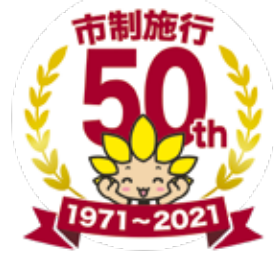
座間市マスコットキャラクター「ざまりん」