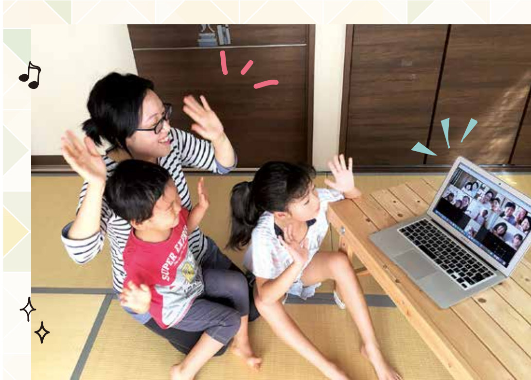
オンラインで対話する親子