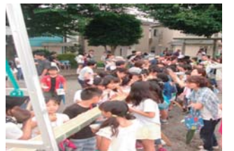
七夕祭りでのそうめん流し

1月のどんど焼き祭り、4月の桜祭り（山王神社祭礼）、7月の七夕祭り、そうめん流し、子供お菓子釣り、古代火起こし、花火大会、8月の芹沢地区盆踊り、10月の中秋の名月観賞などの恒例行事があり、地域の皆さんと交流、親睦を図っています。また、地区自治会連合会では10月に市民レクリエーション大会（スタンプラリー）を行います。