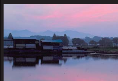
吉田 もとひろ 平成26年5月27日撮影 新田宿