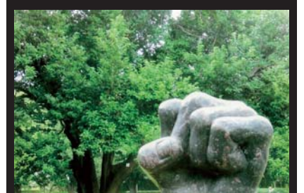
稲葉 勝子 平成30年5月12日撮影 芹沢公園