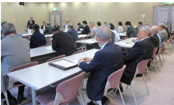
平成28年5月19日定期総会の様子

これに加えて、新消防庁舎や消防の司令業務に対する防衛補助など、この一連の返還を含めて様々なかたちで負担軽減策を国から引き出すことができていると考えています。今後も、基地を抱える街として現実を受け止め、国としっかり向き合い、協調しながら対応を深めていきたいと思えます。