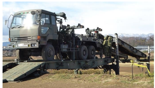
訓練で橋を架ける様子

第4施設群が座間の地に駐屯していることは、災害時などの万が一の時に威力を発揮し、市民の安全・安心に貢献できるものとして、大変頼もしく感じました。