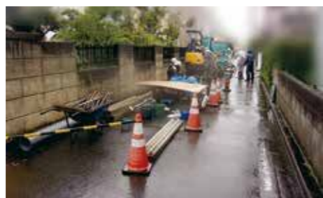
ひょうりがたがめんにとって ほっけん 表裏型顔面把手が発見された現場の様子