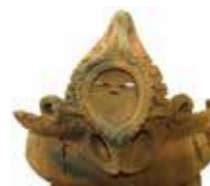
厚木市温水上原遺跡で出土 「顔面把手付土器」