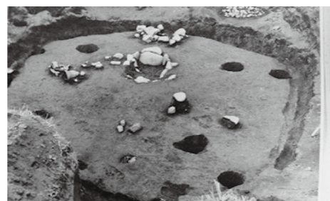
むかし のくらしのあと (蟹ヶ澤遺跡)