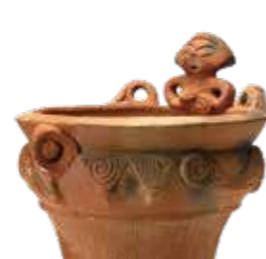
相模原市大日野原遺跡で出土 「土偶装飾付深鉢形土器」