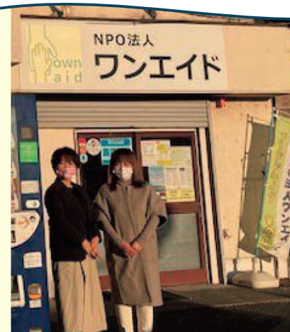
住まいに困難を抱える方の支援を行うワンエイド

このため、今後は、住まいに困難を抱える方の入居を「受け入れる」不動産会社の開拓から、困難を抱える方が「どこに相談すれば良いのかつなぎ先を知っている」不動産会社の開拓へ注力していくこととしている。今後、一層、住まい支援の充実が求められる中で、座間市の新たな挑戦が期待される。