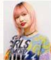
ドラムパフォーマー・ SNSインフルエンサー