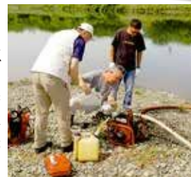
軽可搬ポンプを修理し消火テスト

新田宿連合自治会では防災と美化に力を入れています。令和6年4月に自主防災組織を立ち上げ、震災と水害への対応が本格的にスタートしました。またゴミ集積所の再生や移設にも注力し、住民の慢性的な不満や問題に対処しています。先祖代々お住いの地元民と転入者が混在する地区ですが、お互いに尊重し合いながら上手に暮らしていることが新田宿の大きな強みです。そのことを活かしながら、自治会の価値を再構築してゆきます。