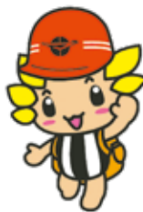
座間市マスコットキャラクター 「ざまりん」

発行/座間市 編集/総合政策部秘書広報課 〒252-8566 神奈川県座間市緑ヶ丘1-1-1 ☎046(255)1111(代表) FAX 046(255)3550