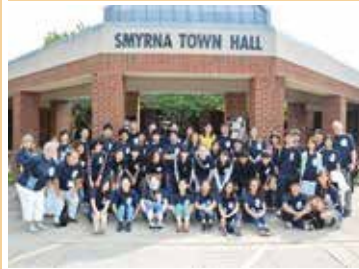
スマーナ市へ派遣