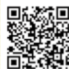
国際親善大使3期生