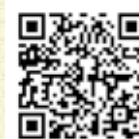
スマーナ市について