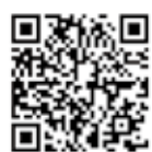
国際親善大使2期生