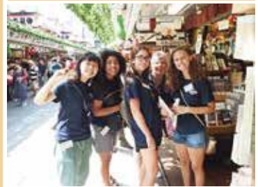
スマーナ市生徒の受け入れ

他にも、国際交流イベントに司会やアナウンスとして参加したり、市内のイベントで大使の活動を報告したりしています。