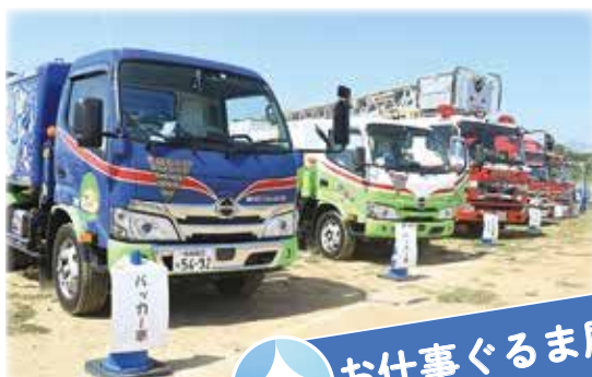
お仕事ぐるま展示