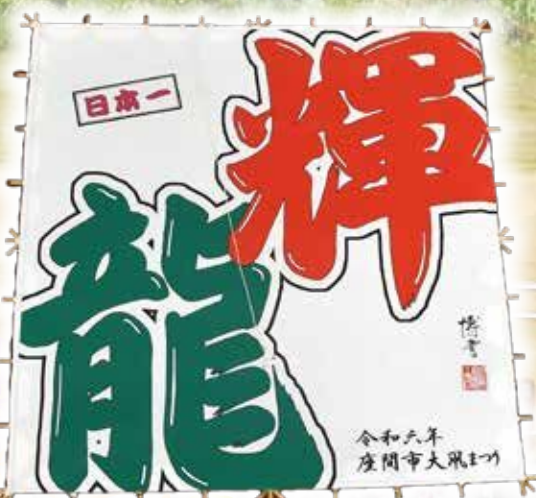
今年の大凧文字「輝龍」