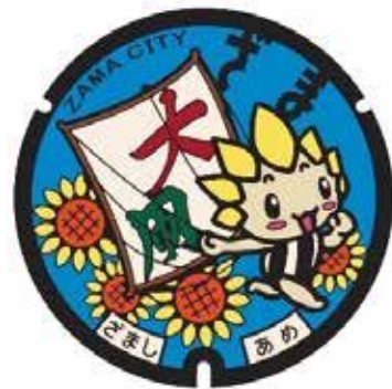
座間市デザインマンホール蓋

須賀川市のデザインは、「市章」の周りに市の花「牡丹」が彩られ、大仙市のデザインは、柳を伴う丸子川にかかる丸子橋から望む西山に「大曲の花火」が彩を添えています。