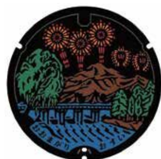
大仙市デザインマンホール蓋

担当 下水道施設課 ☎046(252)8587 (FAX)046(252)8320