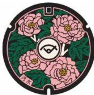
須賀川市デザインマンホール蓋