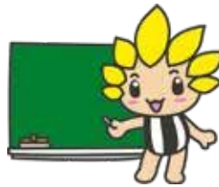
座間市マスコットキャラクター 「ざまりん」

リーディングDXス クール事業の取り組みから、 未来を拓くざまっ子づ くりを目指します。