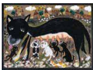
大賞作品「母犬と子どもたち」 (Wachirawit Boonsawat 5歳 タイ)