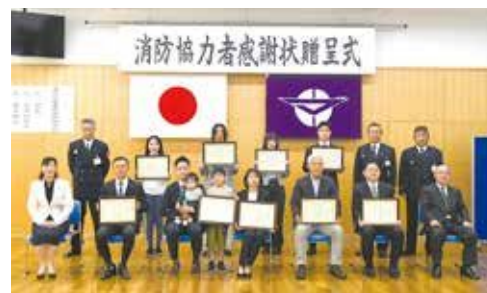
消防協力者感謝状贈呈式集合写真