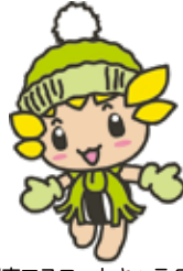
座間市マスコットキャラクター 「ざまりん」

発行/座間市 編集/総合政策部秘書広報課 〒252-8566 神奈川県座間市緑ヶ丘1-1-1 ☎046(255)1111(代表) FAX046(255)3550