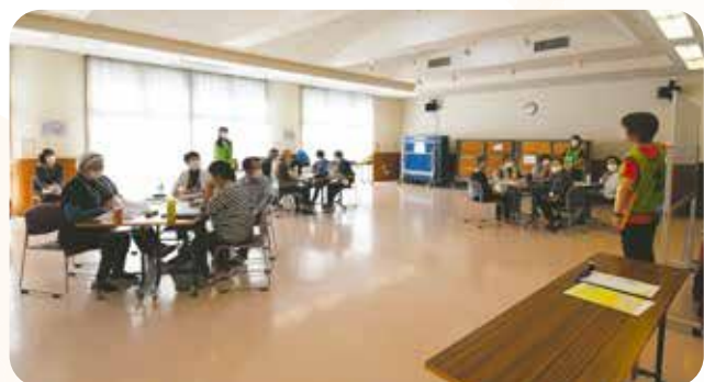
脳いきいき運動講座