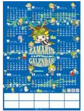
2024年版年間カレンダー

担当 地域プロモーション課 ☎046(252)7961 FAX 046(255)3550