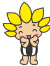
座間市マスコットキャラクター 「ざまりん」

発行/座間市 編集/総合政策部秘書広報課 〒252-8566 神奈川県座間市緑ヶ丘1-1-1 ☎046(255)1111(代表) FAX 046(255)3550