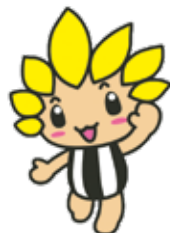
座間市マスコットキャラクター「ざまりん」

発行/座間市 編集/総合政策部秘書広報課 〒252-8566 神奈川県座間市緑ヶ丘1-1-1 ☎046(255)1111(代表) (FAX)046(255)3550