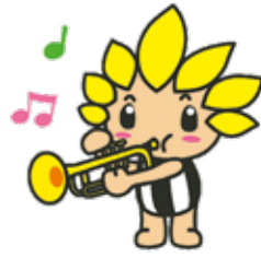
座間市マスコットキャラクター 「ざまりん」

発行/座間市 編集/総合政策部秘書広報課 〒252-8566 神奈川県座間市緑ヶ丘1-1-1 ☎046(255)1111(代表) (FAX)046(255)3550