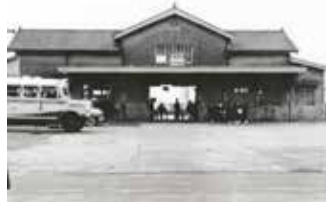
相模台駅前 (昭和35年)

昭和30年代に町公民館で開かれた映画会で使用された座間大通り商店街のカラー広告他、当時の風景や人々の暮らしを捉えた写真を展示します。