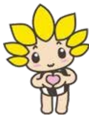
座間市マスコットキャラクター 「ざまりん」

発行/座間市 編集/総合政策部秘書広報課 〒252-8566 神奈川県座間市緑ヶ丘1-1-1 ☎046(255)1111(代表) FAX046(255)3550