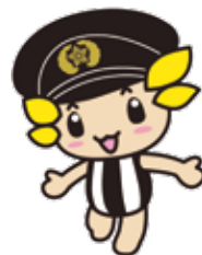
座間市マスコットキャラクター「ざまりん」

発行/座間市 編集/総合政策部秘書広報課 〒252-8566 神奈川県座間市緑ヶ丘1-1-1 ☎046(255)1111(代表) FAX)046(255)3550