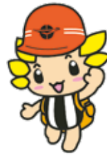
座間市マスコットキャラクター「ざまりん」

発行/座間市 編集/総合政策部秘書広報課 〒252-8566 神奈川県座間市緑ヶ丘1-1-1 ☎046(255)1111(代表) (FAX)046(255)3550