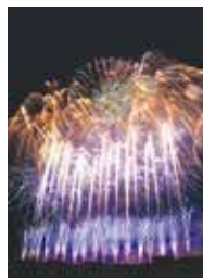
須賀川市釈迦堂川花火大会

市と友好交流都市協定を締結している福島県須賀川市では、8月26日(土)に同大会が4年ぶりに開催されます。 同大会は、約1万発の花火が夜空を彩る、福島県内でも最大規模の花火大会です。