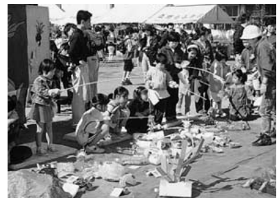
昨年の児童まつり

とき 十月十五日(日)午前10時～午後二時三十分(雨天決行) ところ 中原小学校(駐輪場がないため、車での来場はご遠慮ください) 内容 アスレチックゲーム、筒鉄砲作り、手裏剣飛ばし、模擬店、駄菓子や昔懐かしい品の販売ほか 対象 幼児(保護者同伴)以上の方 なお、十五日(日)は、市内の児童館はすべて臨時休館させていただきます。