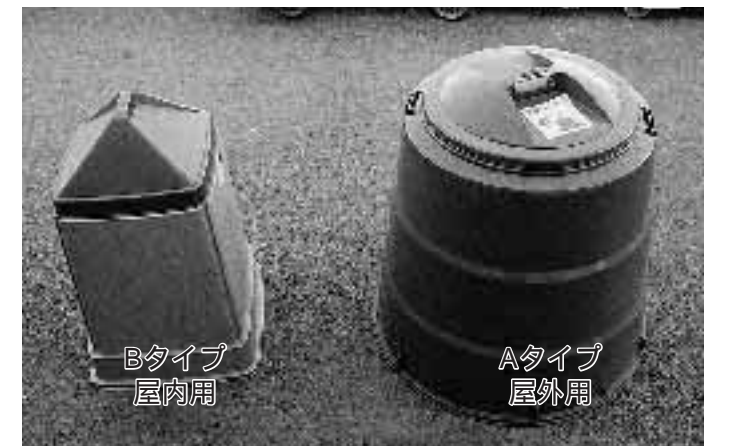
Aタイプ 屋外用 Bタイプ 屋内用

補助の対象者 処理容器の管理および、たい肥化したものを自ら処理できる市内在住の方