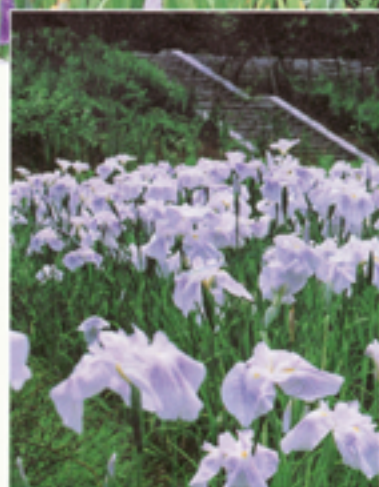
座間谷戸山公園の「座間の森」