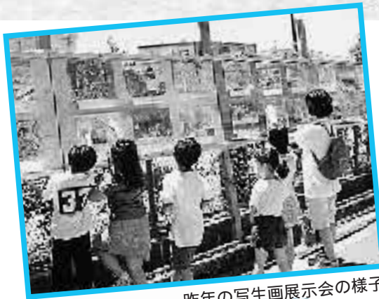
昨年の写真画展示会の様子

この地域は、「藤沢街道」の古道沿いに古くから集落が形成され、「座間郷」の中心地として栄えてきました。また、「番神水」「龍源水」をはじめとする多くの湧水が存在し、この地域に住む人々の生活と豊かな自然環境をはぐくんできました。