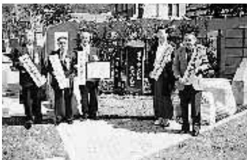
「街なみ景観賞」を受賞された皆さん