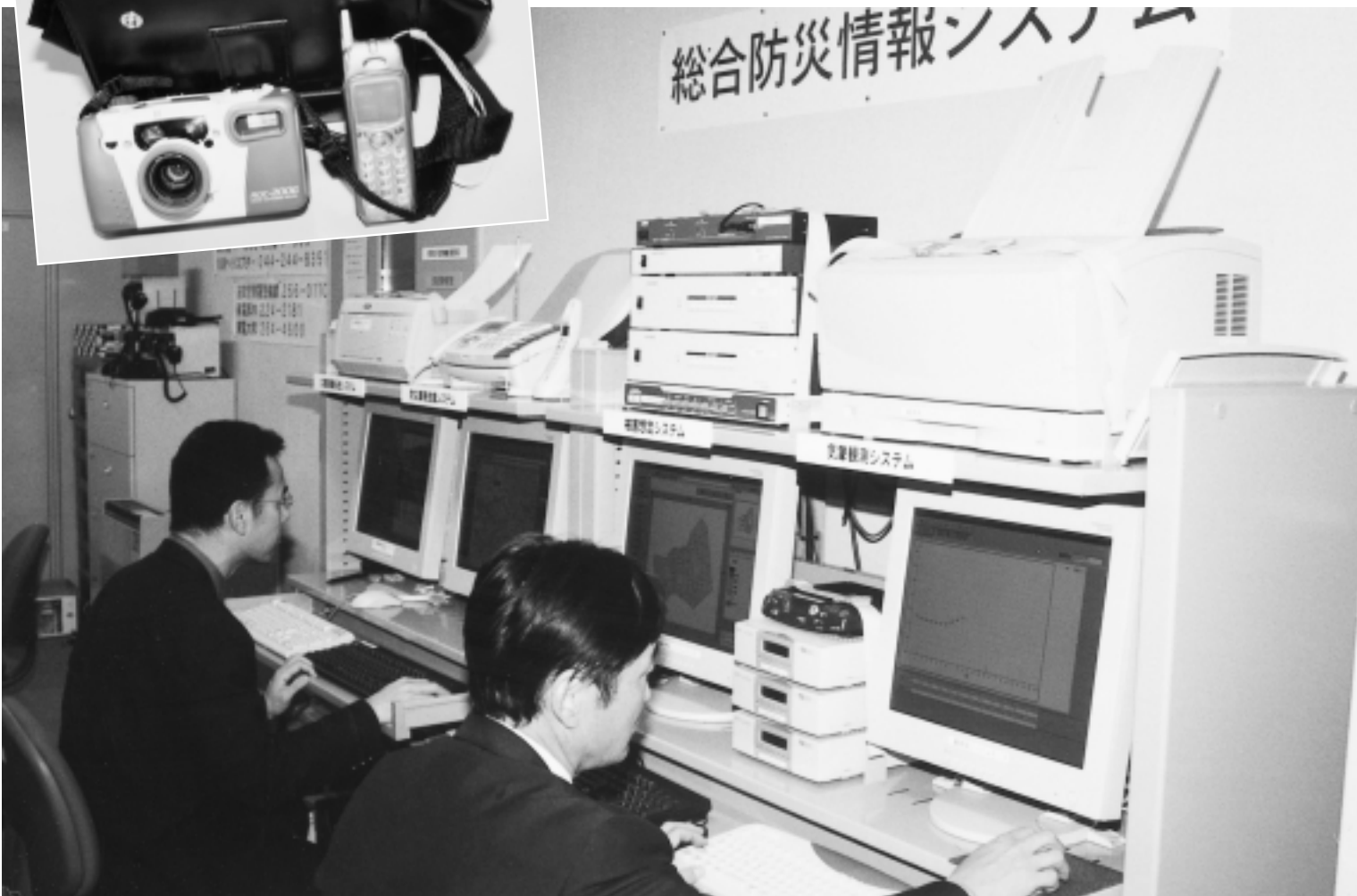
総合防災情報システム（Zシステム）が稼働する防災指令室

市では、大地震発生から最短約三分で、市内各地の被害を予測できる「総合防災情報システム」の運用を開始しました。これは阪神大震災において、被害状況の把握にかなりの時間がかかり、応援要請や交通規制など初動対応が遅れたことから開発したものです。 通称「Zシステム」と呼ばれるこのシステムは、東海地震や県西部地震など、市内に被害をもたらすといわれる大地震に備えたもので、家屋の倒壊や延焼、地盤の液状化など、さまざまな被害を想定することが出来ます。各地点の地震や気象観測計などのデータをN-TTの電話回線を通じて集め、二十四時間稼働する市役所防災指令室のコンピューターで瞬時に分析するものです。 その後、分析したデータを基に市災害対策本部が、市民の避難誘導や人員の配置、救援物資の供給などについての判断資料としていきます。また、市職員がデジタルカメラで撮影した被害現場の様子を電送し、同本部がその画像から具体的な指示を出すことも可能になっています。 今後はこのシステムを通じて、市民の皆さんへの迅速な情報提供と二次災害防止への活用に努めていきます。