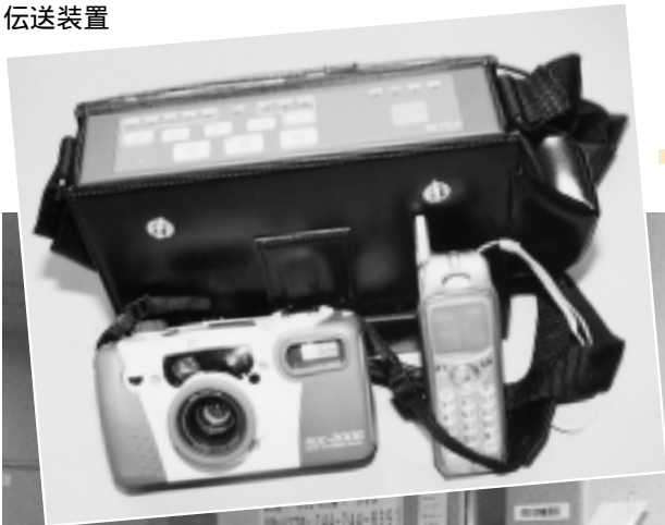
現場の様子を伝える携帯型画像伝送装置