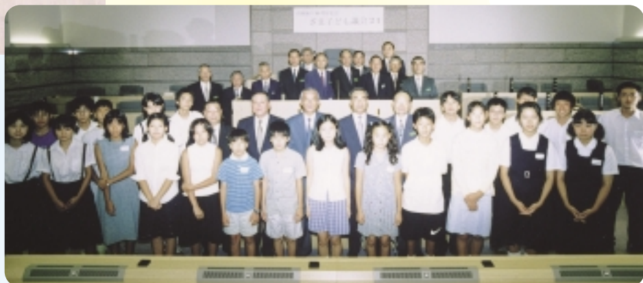
23人の子ども議員の皆さん