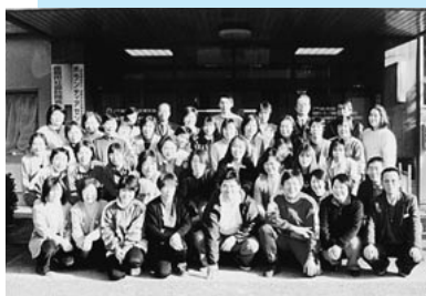
「明るく住みよい福祉の街づくりに共に頑張りましょう」

地域福祉活動の推進 高齢者福祉事業、身体・知的障害児(者)福祉事業、母子・父子福祉事業、催し物など機材貸出事業 援護事業 交通遺児世帯・生活困難世帯・老人援護事業・心身障害児者事業世帯など