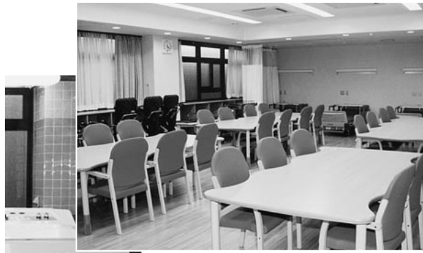
食堂兼日常生活訓練室(1階)