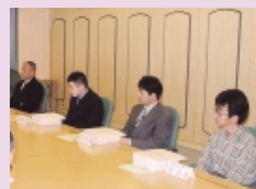
今回表彰を受けた皆さん