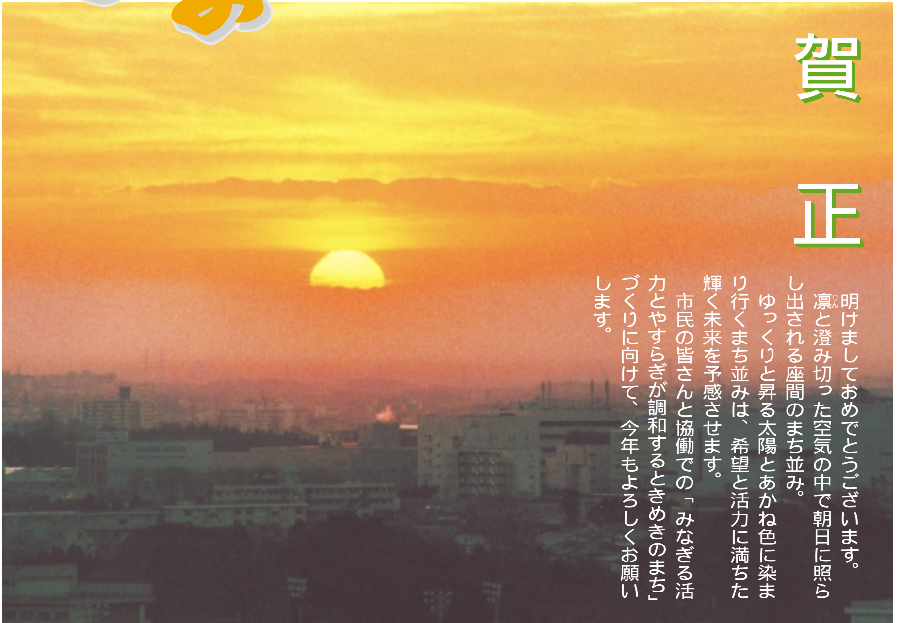
市役所屋上から望む日の出

明けましておめでとございます。 凜と澄み切った空気の中で朝日に照らし出される座間のまち並み。 ゆっくりと昇る太陽とあかね色に染まり行くまち並みは、希望と活力に満ちた輝く未来を予感させます。 市民の皆さんと協働での「みなぎる活力とやすらぎが調和するときめきのまちづくりに向けて、今年もよろしくお願ひします。