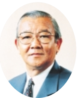
座間市長 星野 勝司