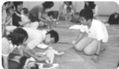
会員、受講者ともに真剣に取り組む講習会

定員 30人(先着順) 参加費 無料 持ち物 折り紙、はさみ、のり 申込方法 直接・電話・ファクスで同館へ