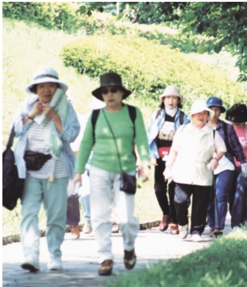
仲間との触れ合いもウォーキングの魅力の一つ

皆さんも、秋に染まる座間の豊かな自然や史跡・旧跡などを巡りながら、健康増進や体力づくりのためにウォーキングをしてみませんか。