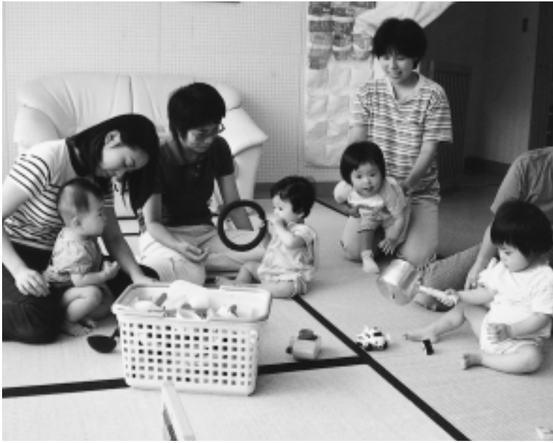
子育て支援センター「赤ちゃんルーム」

子育てに不安はつきもの、完璧なお母さんはいません。ほんの少しお母さんになりましょ... 「困ったなあ」「どうしてよ」「どうしたらいいの」そんなとき、気軽に電話してみませんか。