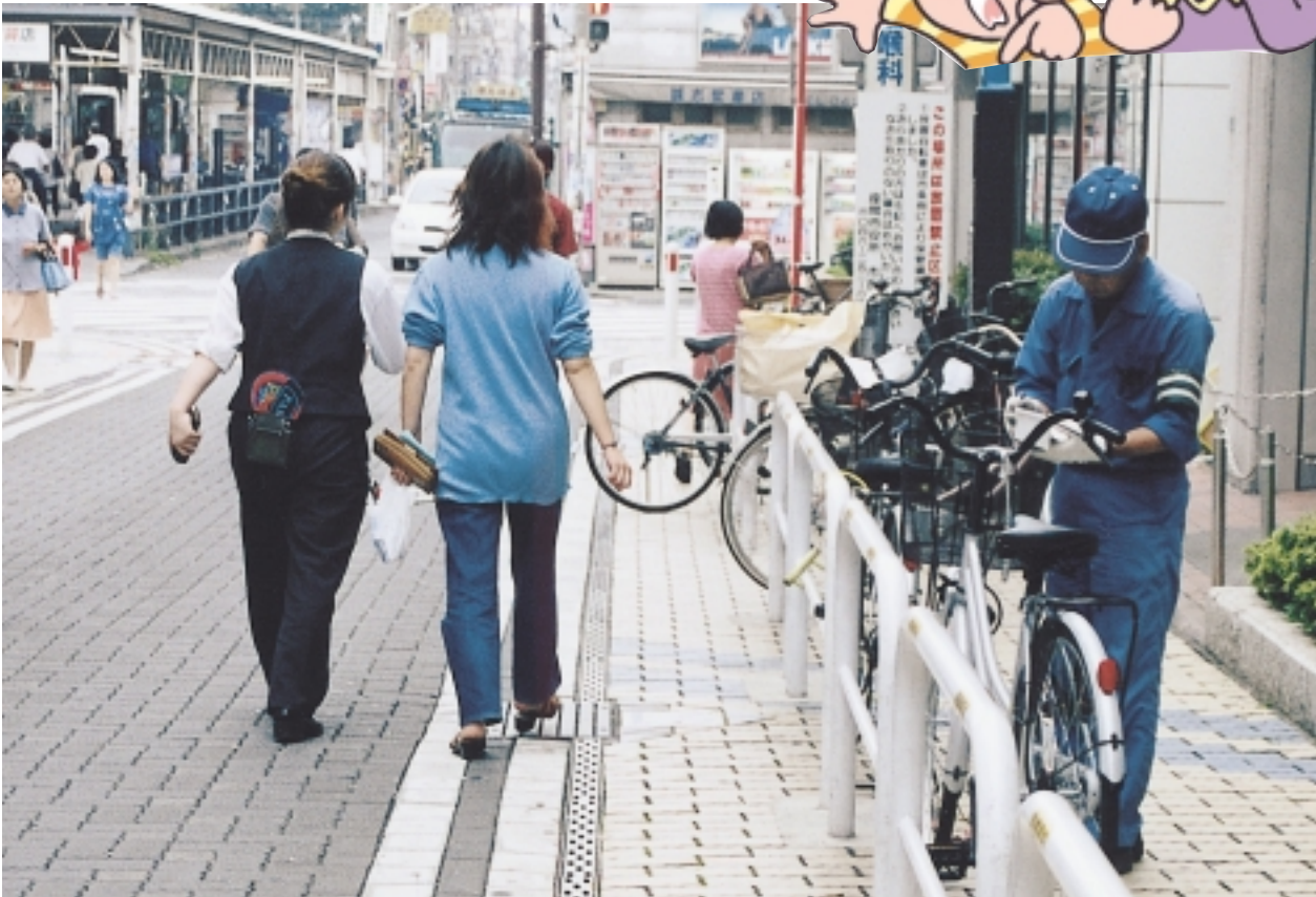
放置禁止区域に放置された自転車は、市が撤去しています