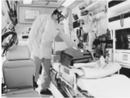
さまざまな設備が整った「高規格救急車」。まるで、小さな病院みたいですね。

救急救命士と高規格救急車は、24時間いつでも出動できるように準備しています。いざというときの心強い味方ですね。