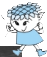
ひまわり イメージキャラクター 「サン」

座間市企画部市民情報課編集・発行 〒228-8566 座間市緑ヶ丘1-1-1 ☎046(255)1111 ☎046(255)3550 《ホームページアドレス》 http://www.city.zama.kanagawa.jp/