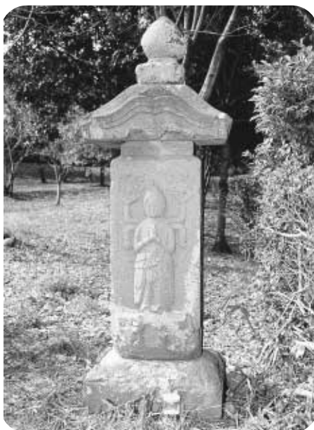
びょうま はら 病魔を払うといわれる しょうめんこんごうぞう ぼ こんしんどう 青面金剛像を彫った庚申塔