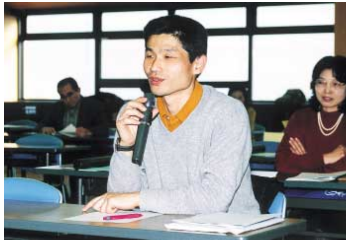
講義の後は毎回活発な質疑で盛り上がりました