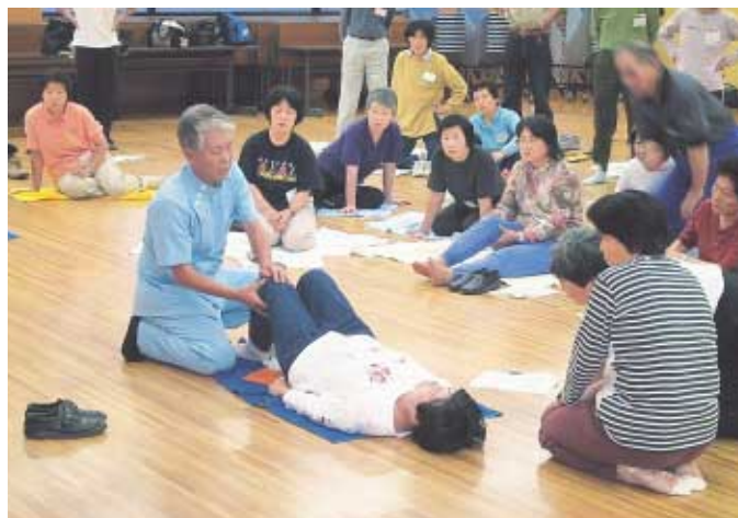
参加型の講座に会場はいつも和やかな雰囲気でした