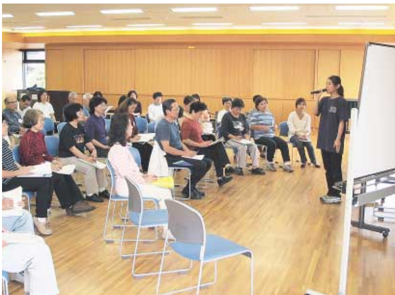
講師の話を真剣に聞き入る受講生たち