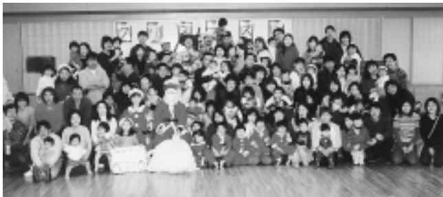
ぴよぴよサークルのクリスマス会での一コマ

同会が運営するぴよぴよサークルは、毎月1回、総合福祉センター(サニープレイス座間)を会場に、ふれあい体操・童謡・手遊び・離乳食などの各種教室や栄養士による手作りおやつ(レシピ付き)子育て相談、栄養相談などの活動をしているほか、ブドウ狩りや小運動会、クリスマス