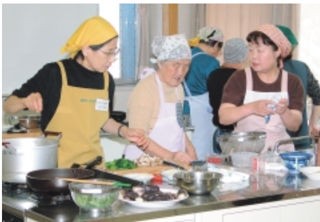
お年寄りを対象にした「ふれあいクッキング」