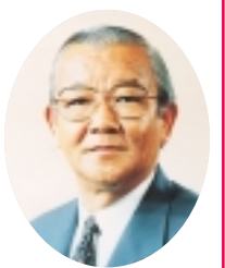
座間市長 星野 勝司