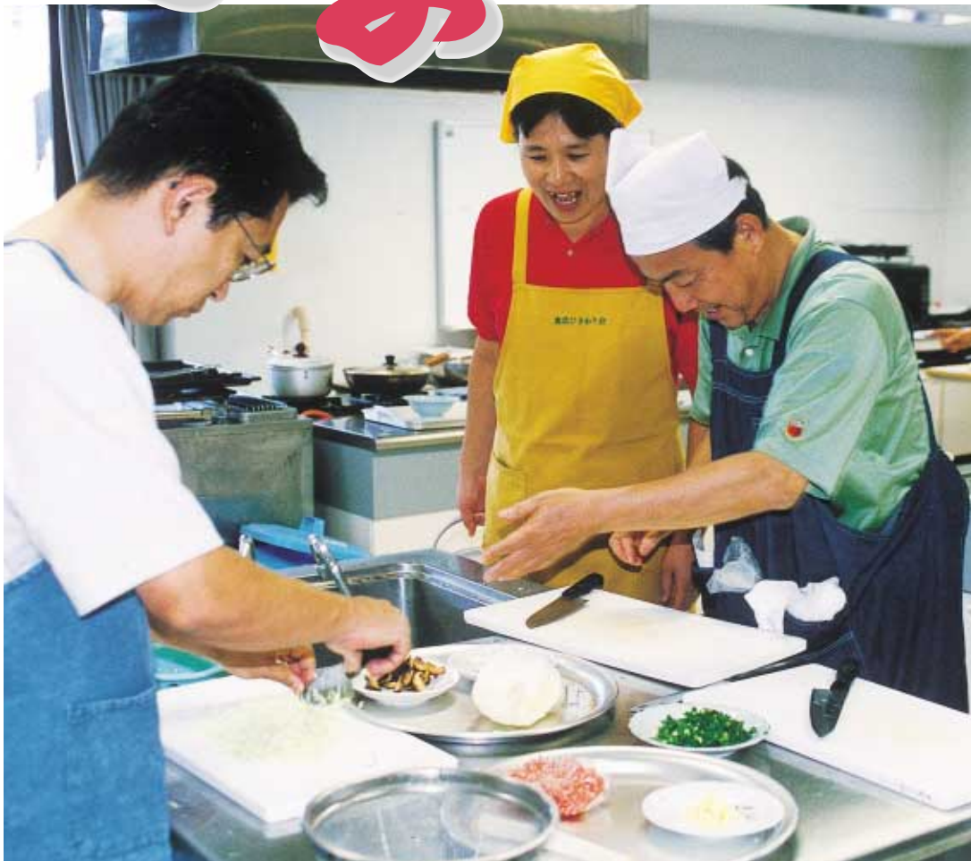
あなたも健康のために、ヘルシーメニューを作ってみましょう