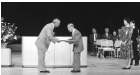
福祉大会での表彰式