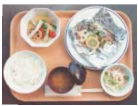
鮭のホイル焼き定食 (540キロカロリー、塩分3.5グラム)