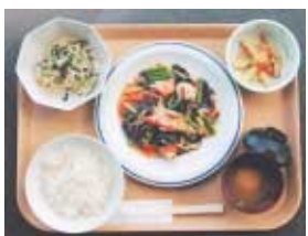
いかの野菜あんかけ定食 (520キロカロリー、塩分3.4グラム)

体に良い料理といっても、いざ作るとなると食材選びや調味料の分量など、何から始めて良いのか戸惑うものです。今回紹介した調理法(右下参照)などから、塩分や油分の加減や食材の組み合わせなどを参考にしたり、生活習慣病予防のための料理講習会(下記参照)に参加したりして、実際にヘルシーメニューを作ってみてはいかがでしょうか。