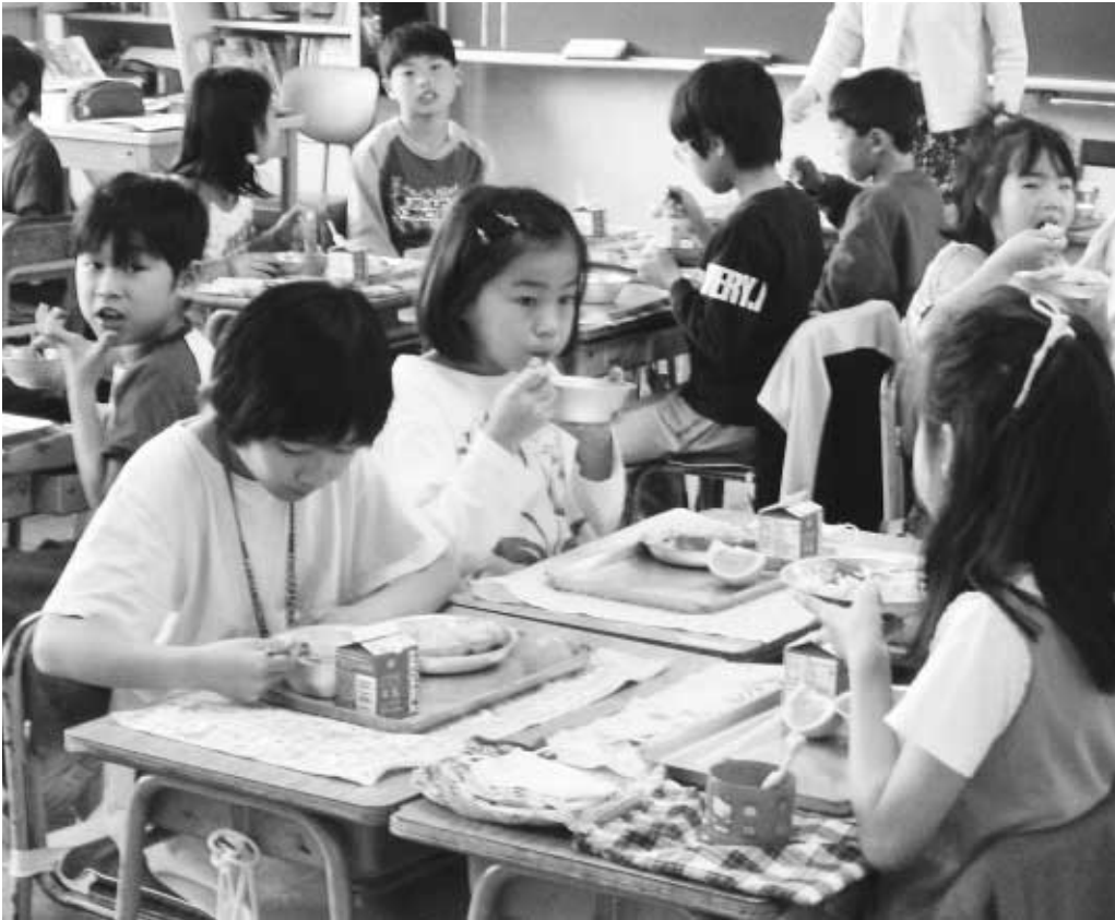
おいしい給食にみんな大喜び！