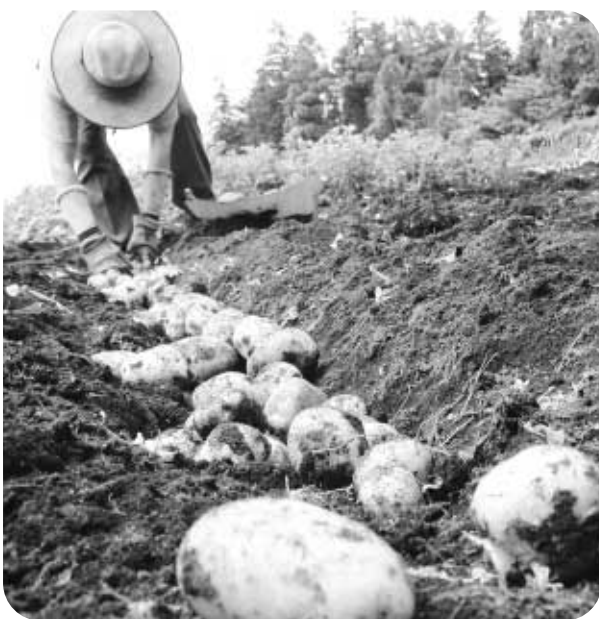
市内の畑で立派なジャガイモが取れました