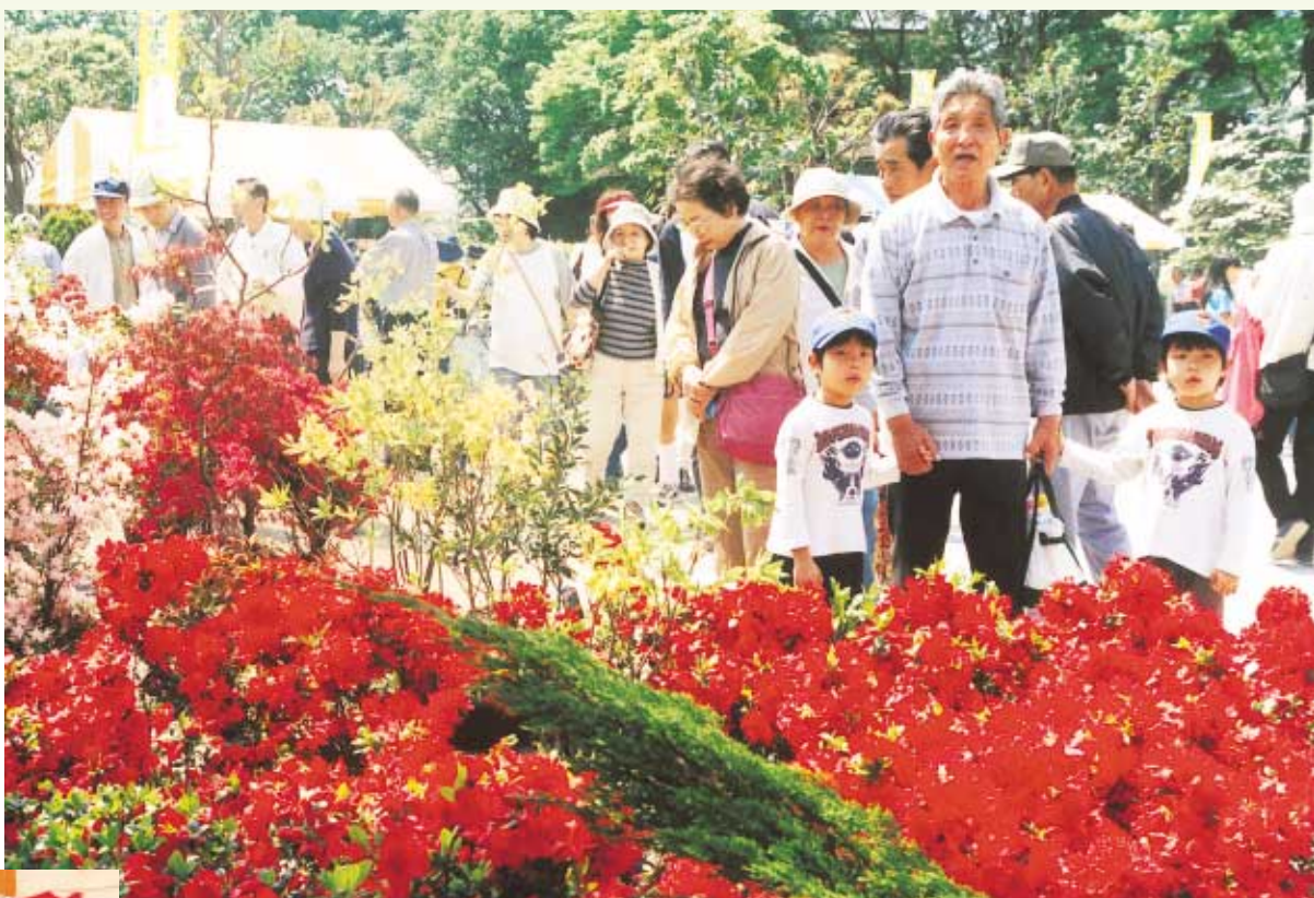
子どもからお年寄りまで、だれもが楽しむことのできる祭りです

新緑の木々の間をさわやかな風が吹き抜けるこの季節。今年も「みどりの日」恒例の「市緑化祭り」を開催します。