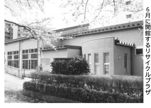
6月に開館するリサイクルプラザ