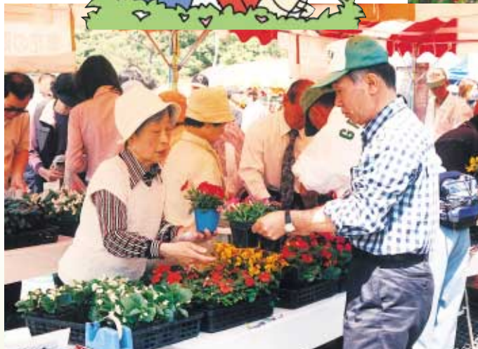
会場では、草花の育て方などを気軽に相談できます