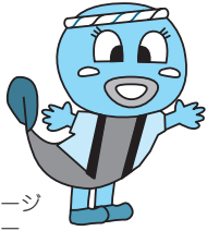
下水道イメージキャラクター「ナマちゃん」