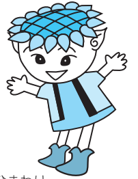
ひまわりイメージキャラクター「サン」