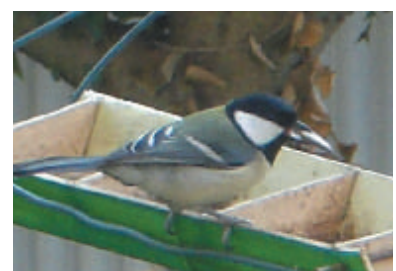
常連のシジュウカラ。スズメと餌を取り合うが、いつも押され気味

間から見えるところにあり、小鳥たちのにぎやかな食事の様子を見ることが出来ます。小鳥たちはそれぞれに個性的で、いつまで見ても飽きません。むしろ、自然が身近に感じられて心が和らぎホッとします。