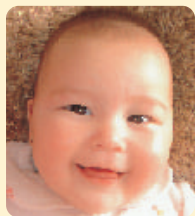
トリクッー くら トリックン 綾羅 夕ハワちゃん H18.9.20生まれ 女 入谷1丁目