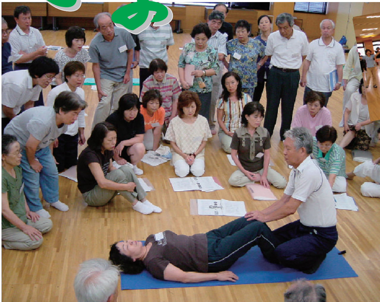
▲心と体のバランスを整え日々の生活を健康的に過ごしましょう