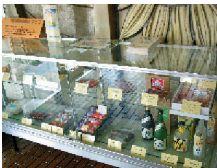
▲新たに設置されたショーケース

市では、平成16年度に制定した市特産品等認定制度を基に、現在20品目を市の特産品として認定しています。認定された特産品は、市役所1階ロビーや市公民館、市商工会で商品の見本をショーケースに入れて展示していますが、このたび北地区文化センター1階ロビーにも新たに商品の見本を展示しました。