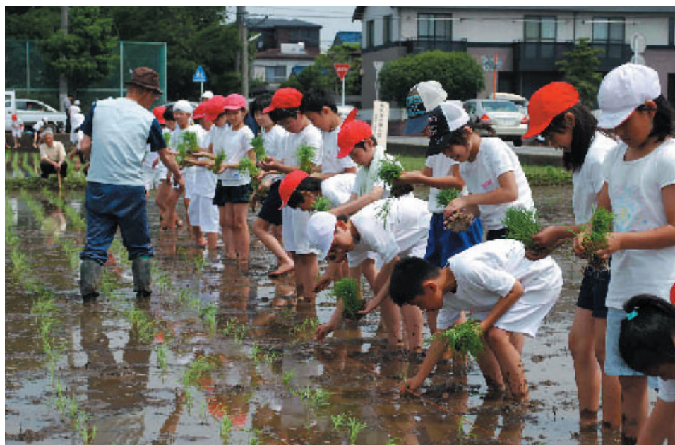
▲6月には、ぬかるむ田んぼに戸惑いながら田植えに挑戦しました