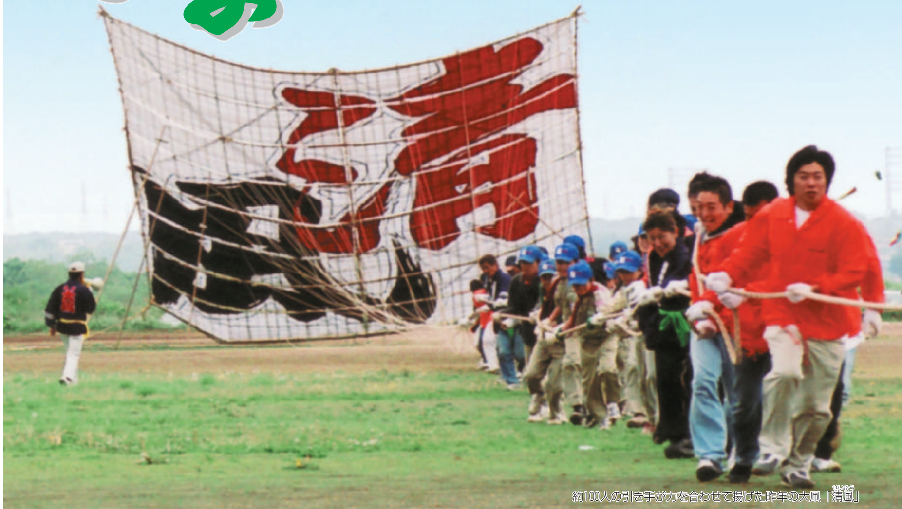
約100人の引き手が力を合わせて揚げた昨年の大凧「清風」