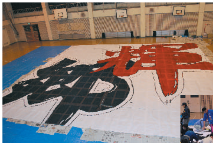
▲体育館の床一杯の和紙に描かれた凧文字「輝郷」 子どもたちは慎重に赤と緑に塗り分けていました▶