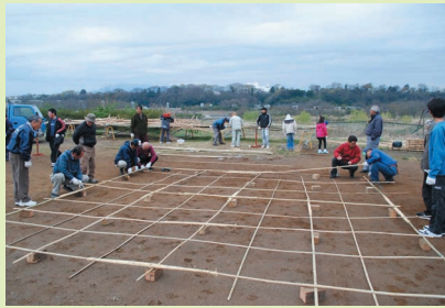
凧を作る 市大凧保存会の皆さん

問い合わせ・申込先 市観光協会 ☎046(205)6515 担当 商工観光課 ☎046(252)7604 ☎046(255)3550