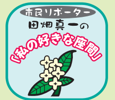
座間市の防災備蓄倉庫

「座間市で地震6強、建物倒壊・火災延焼。これは、あくまで仮定の見出しですが、もし、こんな事態になったとしたら、皆さんはどうしますか。万が一の事態を想定し、市では、市内各所に「防災備蓄倉庫（以後、倉庫）」を設置しています。この倉庫について、私は、市の担当部署や関係諸機関を訪ね、いろいろとお伺いしてみました。まず、倉庫の設置目的ですが、これは前述のとおり大地震などの災害が発生したときの応急対策です。倉庫では、避難所で使う資