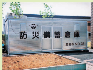
災害時に備えた防災備蓄倉庫

材や機材なども保管しています。市役所近くだけにあるのか、と思いきや、市内の小・中学校、高等学校をはじめ、市公民館や北・東地区文化センター、各コミュニティセンターなどに設置されています。その数、何と五十カ所。さて、お待ちかね、気になる倉庫の中身ですが、。主な一例ですが、ジャッキやバル、スコップなどが入った救助工具格納箱セット、真空パック毛布二百枚、かまど三セット、組み立てトイレ六台、テント式トイレ一台、段ボールトイレが百個、ワンタッチテントが五張、折りたたみみりヤカーが二台、折りたたみ担架が四台、自転車一台という臨場感です。このほかにも、災害時に役立つ物が複数入っています。なお、今ご紹介した物の収納数は、設置されて