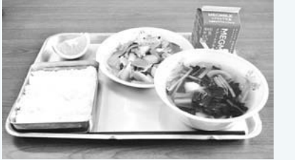
この給食には座間で作られたコマツナとキャベツが使われています

今日の給食にも座間で作られた野菜が入っているかも 「座間で作られた野菜は新鮮で柔らかい。ぜひみんなにも食べてもらいたい」と学校の栄養士さんは話しています。みんなが食べている給食の食材には、学校と農家の人たちが協力して、座間で作られた野菜が使われています。コマツナ、ホウレンソウ、ジャガイモ、ニンジン、ナガネギ、タマネギ、ゴボウ、ダイコン、キャベツ、ハクサイ、サツマイモ...などなど。新鮮で安全な野菜を使って、皆さんの食べているおいしい給食は作られています。