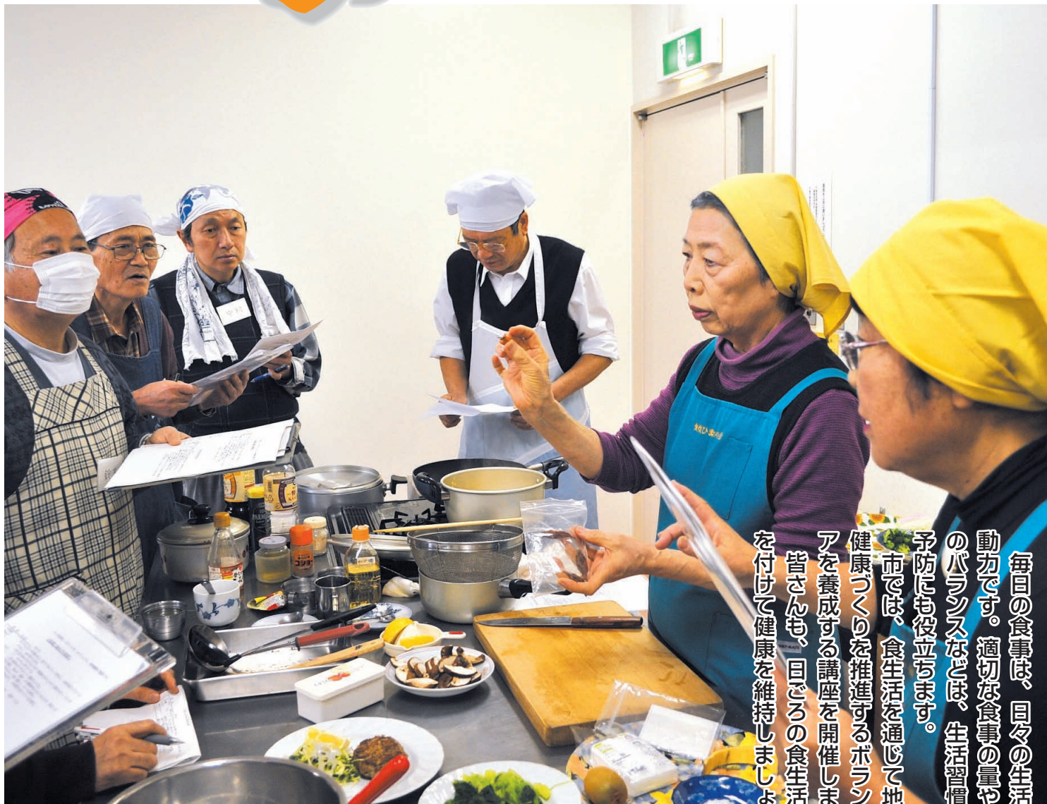
▲「男が楽しむ料理教室」(北地区文化センター)で料理を指導する食生活改善推進員(右)

毎日の食事は、日々の生活の原動力です。適切な食事の量や食材のバランスなどは、生活習慣病の予防にも役立ちます。市では、食生活を通じて地域の健康づくりを推進するボランティアを養成する講座を開催します。皆さんも、日々の食生活に気を付けて健康を維持しましょう。